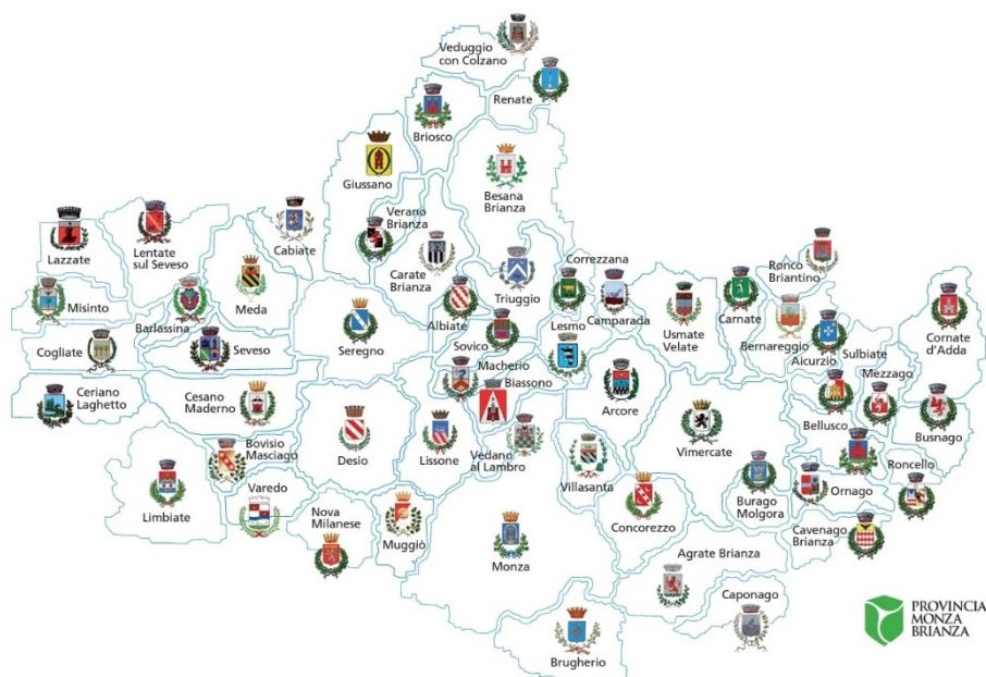
Figura 1.2 - Confini e comuni della Provincia di Monza e Brianza

Il territorio provinciale ha un'estensione di 405,3 kmq, e si sviluppa prevalentemente secondo un asse longitudinale, in direzione ovest-est. La popolazione residente ammonta a 877.663 abitanti (fonte ISTAT, popolazione residente al 19/11/2019), per una densità abitativa molto elevata, pari a circa 2165 abitanti per kmq. All'interno del territorio provinciale ricadono 55 comuni, dei quali il capoluogo risiede nella città di Monza, situata a circa 15 km a Nord-est del capoluogo regionale lombardo, ovvero la città di Milano.